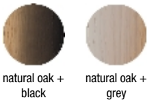
natural oak + black

Top My Gradient colors Farben platte My Gradient